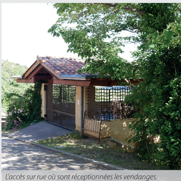
L'accès sur rue où sont réceptionnées les vendanges.