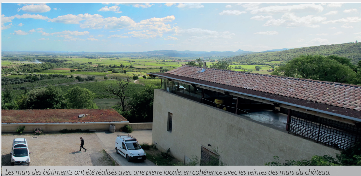
Les murs des bâtiments ont été réalisés avec une pierre locale, en cohérence avec les teintes des murs du château.

À l'ouest, un autre bâtiment réservé à la mise en bouteilles, l'élevage et le stockage s'enterre progressivement et se couvre d'une toiture végétale afin de favoriser une inertie thermique. Il permet aussi l'installation d'un jardin qui s'étend vers le mur de clôture du château. Différenciant les espaces de travail et de repos, une habitation discrète se déploie sur un palier en contrebas de la cour, dans une masse arborée.