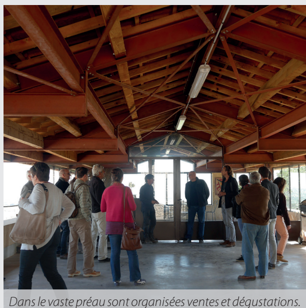
Dans le vaste préau sont organisées ventes et dégustations.